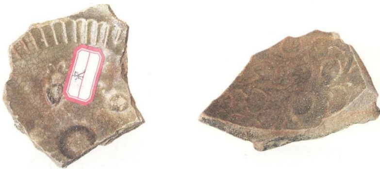
1.青瓷模印菊瓣纹碗残片

丝绸之路上的商品贸易和文化交流从来都不是单向的输出，而是双向的交流与互动。北部湾沿海的防城港洲尾地区发现了几件越南生产的仿广西耀州窑系青瓷碗残片。这些瓷器均为口沿内折，腹壁斜直，圈足低矮；灰白胎，较粗疏，施青釉，部分釉面有开片。纹饰有模印菊瓣纹（图 6-7:1）和模印缠枝花卉纹（图 6-7:2）两种。泥团支钉垫烧，内底和外底常有支钉痕。圈足常见越南瓷器较为典型的“铁汁”底。根据器形、纹饰、胎釉特征和制作工艺来看，与越南北部河内、南定省出土的 12~14 世纪的仿我国耀州窑系青瓷器较为相似。