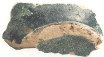
图6-5 柳州正南门城墙遗址出土的波斯陶壶器底残片

条双耳痕迹，肩部环饰联珠纹、并列弦纹、网格纹和水波纹，腹部有弦纹和堆贴捏塑花边等装饰，器形与1965年在扬州城南汽车修配厂出土的一件完整波斯釉陶双耳瓶相似，只是腹部更趋瘦高，更接近公元前4世纪黑海北岸斯基泰人墓葬中出土的希腊银匠制作的双耳银酒瓶造型。桂林市保安总公司工地出土的残片，与扬州出土的双耳瓶较为相似。 [11] 2015年柳州正南门城墙遗址还出土了波斯陶壶的器底残片（图6-5）。