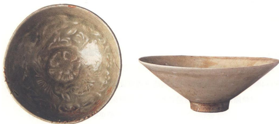
1.青白瓷模印菊花双鱼纹碗

岭垌窑址位于北流平政镇岭垌村，以圩头岭为中心，分布于老虎头山、石梯、缸瓦窑、龙峙、果子湾背等低矮的山丘上。1991年广西文物考古队进行第一次试掘，出土了一件“宣和三年”款印模。1995年进行第二次发掘，清理出一座全长108米的斜坡式龙窑。2015年为配合海上丝绸之路申遗，再次进行调查，发现岭垌窑残存窑炉19座，圩头岭共发现7座窑炉，按西南—东北向依次分布，另在圩头岭西南发现4处面积较大的烧造废品堆积。据调查，岭垌窑址烧造产品以碗（图6-1:1）、盏（图6-1:2）最多，另有盘、碟、壶、灯、流、洗、器盖、魂瓶、盒等；窑具有漏斗形匣钵、筒形匣钵、垫饼、支烧具、火标等。出土印花模具12件，其中有纪年的7件。窑址烧造的器物都是北宋晚期至南宋时期常见的器形，根据“宣和三年”“绍兴二年”“绍兴十年”“乾道三年”“淳熙二年”“开禧丁卯”“庚戌年”“嘉定元年”等纪年铭文印花模具，该窑址的年代应为北宋晚期至南宋时期。