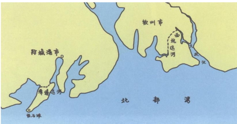
图 6-13 北部湾沿海古运河位置示意图

西坑运河和潭蓬运河作为一个有机联系的整体，构成了广西古代北部湾沿海运河体系。北部湾沿海古运河（图 6-13）的开通，使合浦经钦州湾通向越南的航运更加安全便捷，保障了海上丝绸之路北部湾航段的安全、通畅，促进了北部湾地区的对外贸易发展。这样宏伟而艰巨的工程，在很大程度上是汉唐时期国家开拓南部边疆的象征。“天威遥”，实际上是中国古代仅有的一条海上运河。[17]如果西坑运河的开凿时间在接下来的考古工作中得到证实，那么开通广西北部湾沿海运河的年代更可能早至东汉早期。但其开凿的年代，不管是东汉早期，还是唐代晚期，均比世界著名的苏伊士运河、巴拿马运河等，至少早上 1000 年，其伟大意义不言而喻。