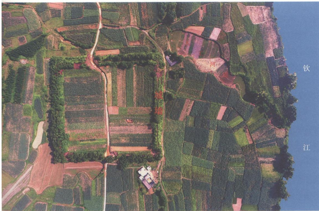
图 6-9 钦江故城航拍图

钦江故城是南朝至唐代初期安州州治所在，遗址位于钦州市东北 25 千米处的久隆镇沙田村东北，东有钦江往南流入钦州市区注入北部湾（图 6-9）。遗址中心地理坐标为北纬 22^{\circ} 06' 03'' ，东经 108^{\circ} 42' 47'' ，海拔高度 16 米。1963 年，广东省文物工作队首次踏查了该遗址。1977 年，广西文物工作队在实地调查时采集到鎏金铜佛像、莲瓣纹瓦当、席纹陶片、绳纹砖等遗物。1981 年，该城址被列为广西壮族自治区重点文物保护单位。2015 年 6 月，为配合钦州“海上丝绸之路重点遗存调查”，四川大学考古学系、广西文物保护与考古研究所和钦州市博物馆等单位对该遗址进行了全面的考古调查。