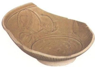
图6—6 鹿耳环江口出土的青瓷碗残片

鹿耳环江口出土的双面刻划花青瓷碗（图6-6），敞口，凸唇，弧腹，圆底，圈足。内壁有篔划及刻花组合纹饰，口沿及内底旋弦纹各一周，外壁划竖线纹。这种内外刻划花，器底修足草率，留有高低不平的旋修痕迹的青釉瓷器，主要见于福建宋代同安汀溪窑系。由于市舶司的设置，这些东南沿海窑场瓷器的发现，可能如《诸蕃志》所载，由福建、广东等地商人“舶以酒、米、面粉、纱绢、漆器、瓷器等为货”，至北部湾沿海进行贸易，贩回香料等土特产。