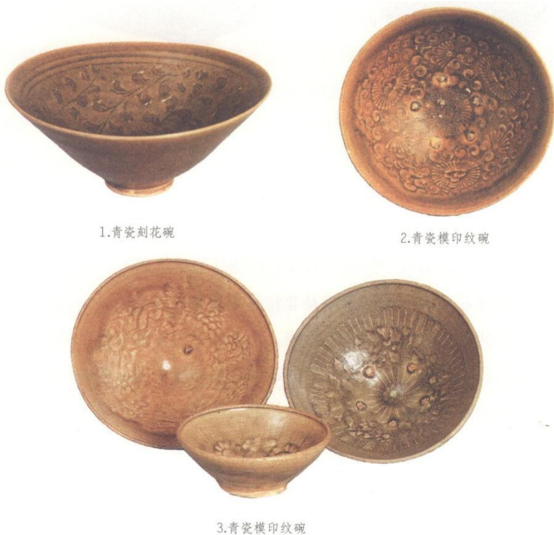
图 6-8 越南出土的 12~14 世纪瓷器 [14]

这些舶来品对输入地的影响并非物品本身的价值高低，而在于它们对人们的思想观念和行为模式的影响。由于耀州窑青瓷行銷世界各地，深受各地人民的喜爱，越南的窑工便试图对其进行仿制，但我国东南沿海地区也曾出现过仿制著名外销瓷的热潮，越南当地窑工获得的“耀州窑青瓷”不乏这些窑口的仿制品。面对琳琅满目的“耀州窑青瓷”，他们自是无法分辨，对各仿制瓷器中包含的技术信息和文化内涵亦不能真正理解，只能基于自身的制瓷技术水平和审美对其胎釉、纹饰等外在特征进行仿制。越南窑工们模仿耀州窑青瓷烧制了灰胎、青釉、器底涂抹铁汁的瓷器，纹饰方面虽也选择了较为流行的缠枝花卉纹、唐子纹（婴戏纹）等（图 6-8:1、图 6-8:2），但这些纹饰在我国仿耀州窑系瓷器中均有仿制，只是不同窑址各有特点，因此越南仿制的牡丹纹与广州西村窑较为相似，唐子纹（婴戏纹）的布局结构和纹饰特征则可能来自北流岭垌窑。印花纹碗、盘内壁从口沿下方到腹壁装饰模印菊瓣纹和蔓草纹，口沿内折，用泥块支钉垫烧、圈足低矮、刮削不平均为仿烧兴安严关窑瓷器（图 6-8:3）。越南的仿耀青瓷中还混入了一些北部湾地区青白瓷的元素，如蔓草叶纹青瓷碗内底斜收呈凸起的小圆圈是北流岭垌窑、容县城关窑、藤县中和窑等景德镇湖田窑系青白瓷窑场北宋晚期至南宋时期的常见器形，少见于青瓷器。这些混合了各窑址特征元素而形成的越南仿耀州窑系青瓷，正是中越两地文化交流与互动的代表性产物。