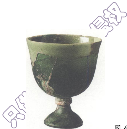
图 6-10 久隆古墓出土的青绿色高足琉璃杯

久隆古墓群是了解宁氏家族及钦州地区历史的重要实物材料。历史上在这里发现过两座有墓志铭碑的墓葬，分别为清道光六年(1826年)出土的宁赞墓和民国九年(1920年)出土的宁道务墓，两位墓主都曾担任过钦州刺史。唐初，宁氏家族雄踞一方，控制了北部湾沿海的重要区域。墓志中提及宁氏先祖“南定交趾之川，北靖苍梧之野”，参与了对林邑(今越南南部)和高丽(朝鲜)的战争。宁氏先祖从水路“铺舶新墉之江，出寇迤缘之海”，反映了钦州地区在隋唐时期与东南亚和东北亚地区较为密切的海上交通联系。