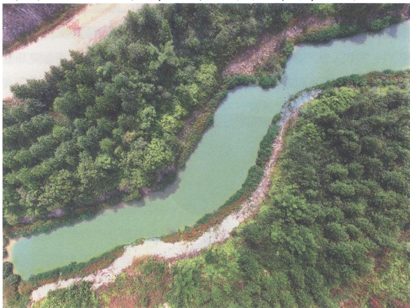
图 6-11 西坑运河局部

西坑运河(图 6-11)位于钦州市钦南区犀牛脚镇，东北利用大风江天然河道，依地势高差将大风江水引入，向西南经九河渡、龙眼山、河山框(岭)，流向大灶江，经沙头港向西可沟通鹿耳环江、金鼓江、钦州湾、防城港直至越南。其中龙眼山—河山框(岭)段为人工开凿，现存长度约 5 千米，河道宽 10~12 米。