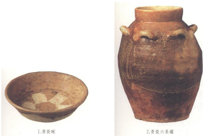
图6-3 越南出土的9~10世纪瓷器

越南出土的9~10世纪青瓷碗（图6-3:1）、青瓷六系罐（图6-3:2），不论器形、胎釉及烧造技术都与两广沿海地区的青瓷窑场产品非常相似。 [9] 青瓷碗敞口、圆唇、斜腹，是雅子冲窑、英罗窑、广东新会官冲窑等常见的器形。灰白胎、青黄釉，釉不及底，内底有6个刮釉的泥片支钉等，都是两广沿海窑场的典型特征。目前虽不能确定其产地，但就交广两地的密切交往来看，极有可能来自两广沿海地区。