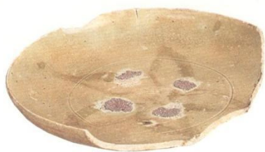
图6-4 青釉褐彩瓷盘残片

鹿耳环江为注入钦州湾的独流入海河流，主要流经钦州犀牛脚镇，于鹿耳环村附近注入钦州湾。2009年当地村民在入海江口挖沙时，出土了一批唐宋时期的青瓷碗、盘。这些瓷器不仅有雅子冲窑场烧造的，还有广东地区窑口的唐代中晚期青釉褐彩瓷盘（图6-4）。该瓷盘为敛口，弧腹，大平底，饼足稍内凹，盘心褐彩绘莲瓣纹，内底残存4个泥片支钉叠烧痕迹。这种青釉下施褐彩的装饰方法在唐、五代时期较为流行，广西周边的江西、湖南、广东等地均有发现，但以泥片支钉垫烧的工艺则主要见于广东及广西北部湾地区。从雅子冲窑址、英罗窑址的制瓷技术看，尚未发现该类釉下彩产品，且胎釉、支钉材料均有较大区别，应是广东地区窑场生产。