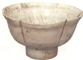
1.青白瓷葵瓣高圈足碗

盏、盘(图 6-2:2)、碟、杯、壶盒、罐、瓶、钵、枕、灯、腰鼓等,而以碗、盏、盘、碟为主。其中一件飞鸟花卉印花模具,背面刻“嘉熙二年戊戌岁春李念龙参造”年款,为中和窑址断代提供了重要依据。结合瓷器器形、纹饰和钱币来看,中和窑址年代约为北宋晚期至南宋时期。