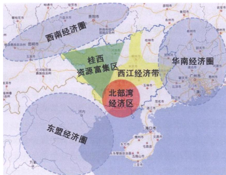
图 1-2 广西“两区一带”战略布局示意图 [2]

广西内部区域发展不平衡、不协调在北部湾经济区强有力的发展中逐步显现。为了促进区域经济的协调发展，发挥北部湾经济区的引领作用，辐射周围城市发展，2009年，国家出台了全面支持广西发展的战略决策性文件《国务院关于进一步促进广西经济社会发展的若干意见》，将广西划分为北部湾经济区、西江经济带和桂西资源富集区三大区域。根据《意见》的规划，将广西划分为：北部湾经济区（包括南宁、北海、钦州、防城港等城市）；西江经济带（包括南宁、柳州、梧州、贵港、百色、来宾、崇左等城市）；桂西资源富集区（包括百色、河池、崇左等城市）。此划分可积极打造西江经济带产业集聚优势、加快与珠三角地区的对接，同时增强资源富集的桂西地区的自我发展能力，重点发展资源型产业。国家全面支持广西新发展，明确了广西通过实施“两区一带”的区域发展总体布局，实现区域互动、协调发展的新思路。此后，《广西西江经济带发展总体规划》《桂西资源富集区发展规划》等指导性规划陆续出台，广西“两区一带”的区域发展格局正式成型[1]。