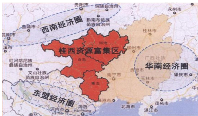
图 1-5 桂西资源富集区地理区位图 [10]

桂西地区是一个集革命老区、少数民族聚集区、边境地区、大石山区、贫困地区、水库移民区于一身的地区，该区域自然资源丰富，有丰富的矿产资源，有铝、锰等有色金属、黑色金属，还有丰富的旅游资源、水能资源，及其他的一些特色资源，包括一些农业土特产资源。但由于基础设施极为落后，长期以来严重制约了当地经济社会发展，制约了人的发展。为改善桂西地区生产生活条件，促进经济社会发展，实现共同富裕，区党委、政府加大了对该区域基础设施投入，如：1996年以来，百色市在广州市对口帮助下开展一系列的扶贫攻坚战；2003年，广西集资20多亿开展的东巴凤基础设施大会战；2007年筹资近17亿元的都安、大化、隆安、马山、天等五县大石山区基础设施大会战；2008年投资14亿多元的桂西凌云、乐业、田林、西林县和隆林五县基础设施大会战；2008年投资4亿5千多万元对防城区和东兴市、靖西县、那坡县、宁明县、龙州县、大新县、凭祥市等8县的开展的兴边富民行动基础设施建设大会战。这一系列的投入，极大改善了桂西地区基础设施状况，改善了当地生产生活条件，促进了桂西地区经济快速发展。如百色市、河池市和崇左市的GDP由2006年的734.79亿元增加到2015年的2281.27亿元，年均增长13.6%，其中第一、第二、第三产业年均分别增长10.0%、14.5%和15.5%。三次产业结构由2006年的27.3:41.5:31.2调整为2015年的20.4:43.2:36.4，其中工业比重由34.4%提高到35.4%。财政收入由2006年的41.88亿元提高到2015年的154.55亿元，年均增长15.89%。 [9]