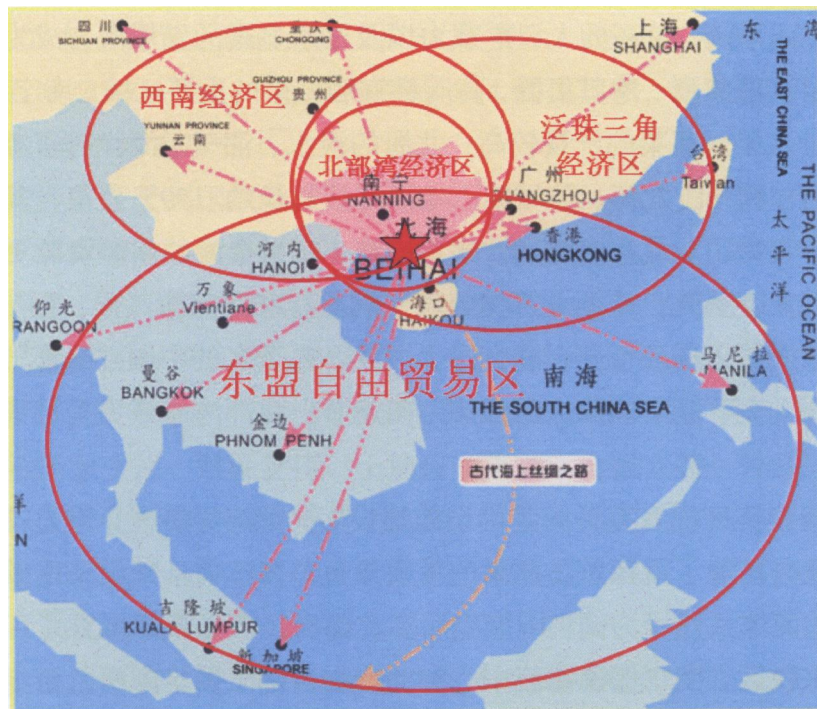
图 1-6 北部湾经济区地理区位图 [13]

从2004年以来，中国—东盟博览会和商务与投资峰会每年都将南宁作为其承办地，形成了中国—东盟合作的“南宁渠道”。泛北部湾经济合作论坛、中国—东盟自由贸易区论坛等活动在南宁的开展为北部湾地区与东盟各国的合作提供了很好的平台。作为“两区一带”、“一带一路”战略下的重要布局点，北部湾经济区有着各方面的区位优势：