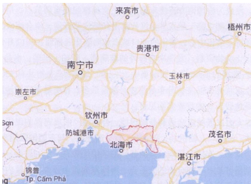
图 1-1 合浦县行政区位图

江河汇集于海始称“合浦”，其历史已有 2000 多年。如图 1-1 所示，合浦县位于广西壮族自治区沿海“金三角”的东部，隶属北海市，位于广西南端，北部湾东北岸，东与广东省廉江市和广西博白县接壤，西与钦州相邻，南临北部湾。合浦县是各地进出北海口岸的门户和大通道，又是广西和大西南进出广东、海南、香港、澳门和东南亚各国的通道。