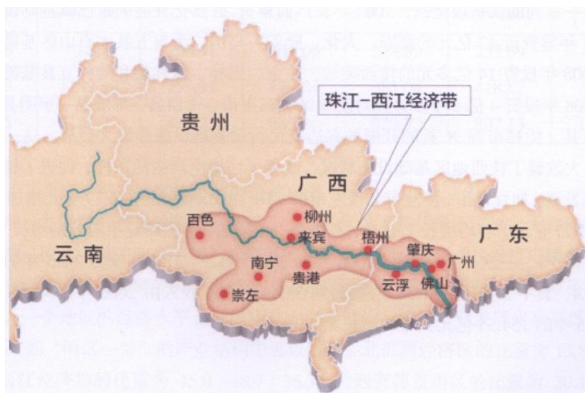
图 1-4 珠江—西江经济带地理区位图 [7]

西江是珠江主干流,位于广西东部、广东西部,背靠大西南,东接珠三角。河长 2074.8 千米,流域面积 35.5 万平方千米,水资源丰富,是我国重要的一条水运通道。西江水系是两广交通运输的大动脉。西江水道西接资源富集的云贵,东连经济发达的粤港澳,随着西江水系的开发和整治,西江将成为贵州煤炭、西南磷矿外运广东和北方地区的重要通道,在东西部地区间的物资流通和促进产业转移上意义重大。国家决心推动西江经济带建设,这不仅有利于发挥西江的水运优势,促进粤港澳产业转移,也有利于促进大西南的资源开发,发挥我国东中西的互补优势,有利于打造沿江新兴的加工制造业基地、现代农业示范基地、区域性航运物流中心。进入新世纪后,区党委、政府日益重视西江的积极作用,加快西江流域经济发展。2008 年,广西提出建设西江黄金水道,并逐年加大投入整治力度,提高西江航运能力。西江流域经济总量不断扩大,产业结构不断优化,地区生产总值由 2006 年的 2720.33 亿元提高到 2015 年的 8657.32 亿元,年均增长 14.0%,高于同期全区 0.4 个百分点,三次产业结构由 2006 年的 19.7:41.9:38.4 调整为 2015 年的 15.0:48.7:36.6,第一产业和第三产业比重分别下降了 4.7 和 1.8 个百分点,而第二产业比重提高了 6.8 个百分点。