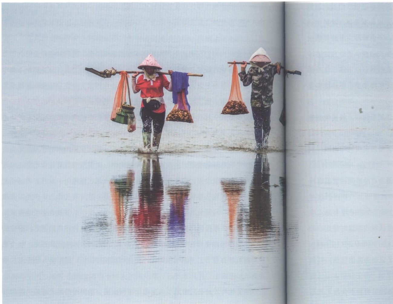
《赶海归来》

随着北海湿地公园征地工作完成，下村大部分的养殖场纳入湿地公园的版图里，下村的养殖场几乎被征用，剩下不多的养殖户继续搞养殖外，其余的逐渐向旅游商业转移。随着中信国安第一城的座落，宜居与旅游环境的日臻成熟，大冠沙金海湾纯美的自然景观与“海上森林”红树林，以及精灵化身的白鹭……为世上越来越多的目光所惊艳，金海湾这片如蓬莱的旅游仙境成了无数人趋之若鹜的名胜。毋庸置疑，湿地公园、金海湾、中信国安等旅游名胜，将是下村优盛的后花园，下村的旅游前景不可估量。