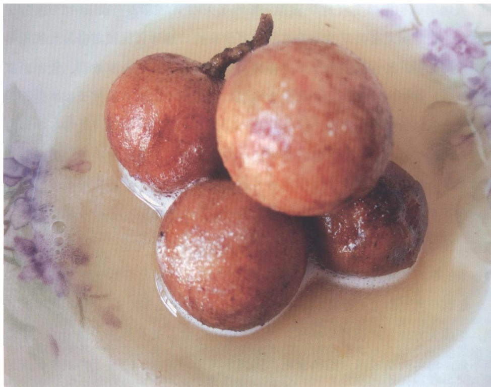
蜂蜜腌黄皮

每到夏天，南方农村的香芒、番桃、龙眼、菠萝、九层皮这些野果子已挂满枝头，那一串串像金弹子压低了树梢的野黄皮果更是相当惹眼。黄皮果可以做食物，也可以入药，味甘香重，诗人曾礼赞：“碧树历历金弹垂，膏凝甘露嚼来奇。木奴秋色珍如许，那似香飘褥暑枝。”