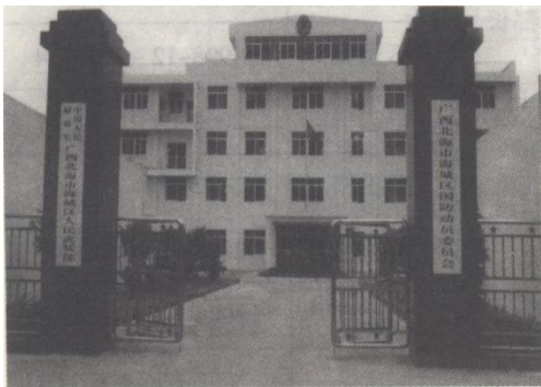
海城区人武部营院

区，双重领导关系和职责任务不变。设军事科、政工科、后勤科，配部长、政委，副部长兼军事科长。辖区有基层武装部 15 个。2003 年 12 月，建成新的独立营院，建筑面积 12.2 亩，其中办公楼建筑面积 1458 平方米，宿舍楼占地 999 平方米。2005 年，执行新的编制。