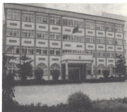
银海区人武部独立营院

郊区（银海区前身）人民武装部于1986年6月14日成立，，后即按中共中央[1986]5号文件，改归地方建制，称“广西壮族自治区北海市郊区人民武装部”。为副县级机构，受北海市军分区和中共北海市郊区委员会双重领导。编制7人（干部5人，职工2人），设部长、政治委员、参谋、干事、助理员、仓库保管员、司机各1人。1994年12月，郊区人民武装部改称银海区人民武装部。1996年4月，根据中央文件，银海区人民武装部收归人民解放军部队建制，改称“中国人民解放军广西北海市银海区人民武装部”，为正团级单位，隶属北海军分区，双重领导关系和职责任务不变。设军事科、政工科、后勤科，配部长、政委、副部长（兼军事科长）各1名，辖区有镇、场8个基层武装部。2003年12月，建成新的独立营院，建筑面积8亩，办公楼占地1458平方米，宿舍楼建筑面积999平方米，车库建筑面积136平方米。2005年，执行新的编制。