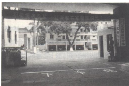
北海军分区机关营区

1987年7月28日，北海市军分区接管原归钦州军分区分区管辖的合浦县人民武装部，同年12月接管隶属钦州军分区的海防营守备连；1988年10月16日，接管由钦州军分区代管的广州军区守备54448部队、广西军区船运队和“792”侦察渔船。分区机关扩编，主要肩负抓部队建设和民兵预备役建设两项大的工作，并负责海防守备和警戒巡逻。