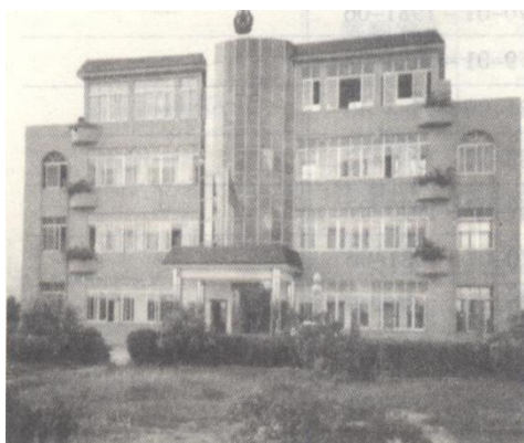
合浦县人武部办公大楼

1959年1月，合浦军分区撤销，合浦县兵役局隶属广东湛江军分区。同时，县兵役局又称县人民武装部（兵役局名称继续保留，实行一套人马，两块牌子）。