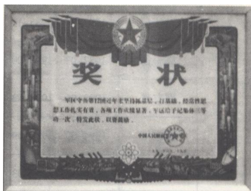
1991年，守备部队获广州军区记集体三等功1次