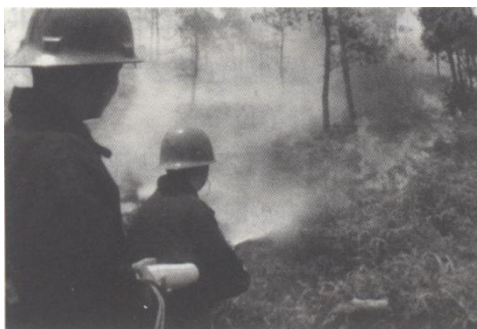
消防战士在扑灭山火

中国人民武装警察部队北海市消防支队是1991年12月27日由北海市公安消防大队改称的。1992年3月6日，由副团级升格为正团级建制。下设司令部、政治处、后勤处、防火处4个职能部门。下辖海城消防大队、银海消防大队、铁山港消防大队、合浦消防大队和4个中队、1个消防执勤点，隶属于中国人民武装警察部队广西消防总队，受北海市公安局领导。武警北海市消防支队是依法代表政府对社会团体、企事业单位和个人实施消防安全监督管理的职能部门，是一支担负防火灭火和社会救援任务的军事化、专业化队伍，为北海市经济建设和社会稳定营造了很好的安全环境。1997~2005年共接警1562起，出动消防车2966台次，消防官兵19623人次。2003~2005年抢救人员91人次，抢救财产8500万元。