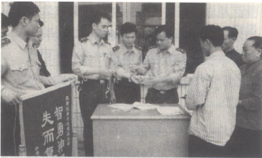
边防支队官兵为群众排忧解难

中国人民武装警察北海市边防支队原为北海市公安局边防武装警察支队，是由北海市公安局边防科 1987 年 7 月升格组建的。它的前身为 1979 年 5 月组建的北海市公安局海防分局，同年 7 月改称边防保卫局，管辖水上、高德、地角、咸田、涠洲、龙潭、电建等边防派出所。1980 年 10 月，边防保卫局又改为北海市人民边防武装警察大队。1986 年 8 月，北海市人民边防武装警察大队撤销，成立北海市公安局边防科。1987 年 7 月，北海市公安局边防科升格为北海市公安局边防局，并称北海边防武装警察支队。1989 年 4 月后改称“中国人民武装警察北海市边防支队”，隶属武警广西边防总队和北海市公安局，现下辖 1 县 3 区的 4 个边防大队和 22 个正营级建制的边防派出所（工作站），既行使派出所职能，又行使处理沿海涉外事务职能，做到以“边防执勤”为中心，加强对边海防的管理。至 2005 年，共破获各种大小案件 3 万多宗，抓获各类犯罪分子 43984 人。特别在打击“贩枪、贩毒、走私、偷渡、外逃和海上武装抢劫”专项斗争中，破获偷渡外逃案件 85 起，抓获偷渡分子 3890 人，缉获走私汽车、香烟等赃物价值人民币 4000 多万元；