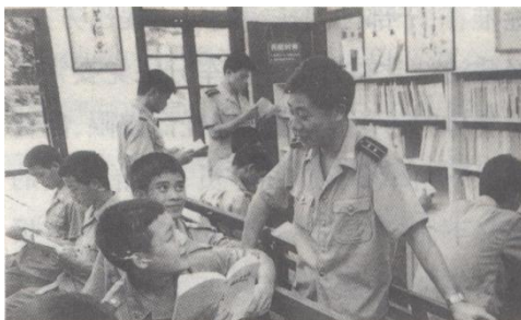
海防 75494 部队领导与连队战士交流学习心得

要求的经验。广州军区专门组织力量编写了《海防 75494 部队经常性思想工作经验 30 例》下发部队。进入新世纪，北海军分区所属部队经常性思想工作适应形势的变化又有新的发展，着力解决少数官兵不思进取、贪图享乐、对外交往多、婚恋不严肃、超前消费等问题。采取多角度、多样化形式继续开展读书育人活动，加强法制教育，落实“双休日”管理规定，坚持把经常性思想工作与经常性管理工作结合起来。充分发挥团支部、军人委员会和思想骨干队伍的作用，广泛开展“四个知道，一个跟上”（知道战士在哪里、在想什么、做什么、需要什么，思想工作要跟上）和“四不一有”（不抽烟、不下馆子、不进发廊、不要家里寄钱，人人有存款）等活动。坚持团每月、连每半月分析一次思想形势，查找薄弱环节，及时发现解决现实思想问题。把解决思想问题与解决实际问题相结合，开拓思想工作的新渠道，通过组织出面，政治机关发函，帮助解决官兵家庭涉及邻里纠纷、婚恋受挫、优抚工作不落实、伤残战士难安置等问题，按照“一帮一”分工责任制，做好个别人的思想转化工作。2004 年，军分区在帮助解决实际问题上下工夫，为使近年 36 名随军家属的安置工作落实到位，专门成立了随军家属工作安置领导小组，积极与市有关部门协调，做了大量艰苦细致的工作，审查批复给予 63 名随军未就业的家属发放了生活补助和养老、医疗个人账户，为 15 名干部子女解决了入学入托问题。