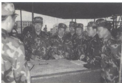
军分区领导在研究演练方案

每年采取集中授课、个人读书、函测作业等形式进行。以岗位练兵为平台，结合本职岗位，分别进行军事理论、军兵种知识、轻武器操作、指挥自动化系统运用、机关业务基础、体能等课目训练，课目合格率达到 87%。2004 年军分区机关参加广西军区组织的岗位练兵活动考核，9 个课目全部合格，6 个课目受表扬。军分区组织所属海防部队机关和 4 个县区人武部进行岗位练兵交流，抽考海防 75494 部队机关 11 个课目，10 个优秀、1 个良好；抽考人武部 4 个科目，平均分达到 90 分以上，成绩优秀。