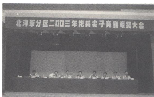
2003年炮兵尖子竞赛颁奖大会

20世纪90年代以来，军分区部（分）队通过叫响“当兵不习武，不算尽义务。武艺不练精，不算合格兵”的口号，营造了刻苦训练的氛围。各单位广泛开展“神枪手”、“神炮手”、“技术能手”等群众性练兵活动和“创纪录、挂奖牌”达标竞赛活动，及时发现训练尖子并组织集训，下大力培养提高，为部队训练树标杆、刻样板。1995年，军分区共产生各类训练尖子42人，有1人破1项广州军区纪录，6人次破3项广西军区纪录；1997年，军分区评选产生达标训练能手396人次，8月份组织36人参加广西军区组织的炮兵尖子“创纪录、挂奖牌”竞赛活动，有14人获得各专业前三名，其中有3人次破广西军区纪录，2人次获广西军区单项第一；2000年“八一”前夕，参加广州军区举行的“科技练兵人才大比武”中，参赛18人，取得海防炮兵7个第一、后勤船艇3个第一、5个项目4个全能第一的好成绩。