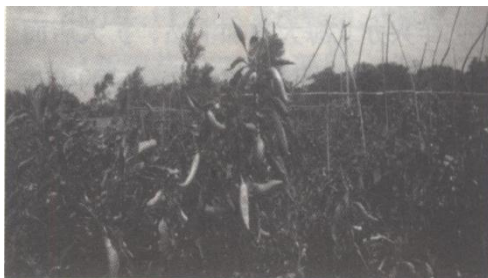
1996 年，海防部队辣椒生产基地

2003 年后，依据总后勤部《军队农副业生产管理规定》和《广州军区农副业生产管理规定》，各级领导强化了对农副业生产的管理，努力实现优质高产高效，增强自补能力。团副食品生产基地集中搞好种养新技术引进推广和种养骨干培训，为连队提供无公害农副产品、优良种苗、人才培养及技术服务，连队主要搞好种菜养猪、养鱼和小菜腌制加工的群众性生产，因地制宜地发展其他种养项目。同时，加强了统计核算和监督。基层单位认真填写《农副业生产登记本》，军分区和团每年定期组织对生产统计数据进行检查监督，减少和杜绝了非生产性开支，不断提高了基层官兵的生活水平。2004 年，军分区部队共产蔬菜 13.37 万斤、产鱼 6235 公斤，出栏猪 327 头，三鸟 6880 只，还自产了一批牛、羊、兔等牲畜，蔬菜、肉类生产基本达到自给。