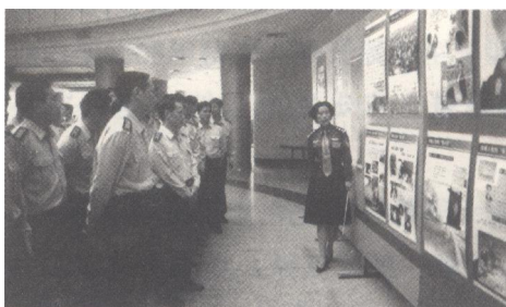
官兵参观国防教育图片展

国防教育是面向全民性的长期的综合教育，北海市在实践中注重实行经常教育与集中教育相结合，普及教育与重点教育相结合，理论教育与行为教育相结合，针对不同对象开展形式多样的教育活动。市和所属各县（区）采取的基本教育方法有三种：一是专题教育。对民兵、预备役人员，按照上级印发的国防教育教材分专题、系统进行国防教育。军分区领导每年都到市委党校给中青年干部培训班上国防知识和形势教育课；中学主要通过军训期间安排专题国防教育课进行教育；部队、政府机关、工厂、企事业单位适时组织国防教育报告会、演讲会，举办专题讲座、国防知识竞赛、放映国防教育影片、参观“国防教育图片展览”和“人民解放军兵器发展巡回展览”等，这些集中的专题教育，人员、时间比较落实。如1997年全市广泛开展以贯彻《国防法》为主题的国防教育月宣传活动形式多样，以各种法规材料、电视、墙报、标语、送发《中国国防报》和《国防法》宣传特刊等形式，加大宣传力度；举办国防知识竞赛、演讲、书画展、文艺演出等群众喜闻乐见的活动，增强了《国防法》宣传的吸引力和感染力。二是纳入。即将国防教育内容纳入民兵政治教育之中，纳入学校教育计划，纳入地方全民教育之中，使国防教育经常化。北海电台、电视台开设了“国防在我心中”、“军旅生活”、“当兵的人”、“双拥动态”等专栏，经常开展国防教育；《北海晚报》、《沿海时报》、《银滩旅游报》、《北海建设报》等也根据自己的实际开展了国防教育系列报道。军分区所属船队，帮助市第一小学，建立了“少年陆军学校”，统一服装、每周学生都按计划进行活动，培养了学生热爱国防、吃苦耐劳的精神，锻炼了学生的身体素质和心理素质，提高了国防意识，加强了组织纪律性，学校的教学质量始终名列前茅。海军驻北海某舰艇部队帮助市第八小学建立“海军少年军校”，组织少年“海军”到舰艇上与官兵同吃同住同训练，组织开展军事实践活动，体验部队生活，使少年学生既增长了知识，磨炼了意志，又增强了热爱国防、热爱军队的意识。三是结合。即结合其他教育，结合各种有利时机和一些重大活动，普及国防教育。如结合形势教育、结合战备教育、结合开展“双拥”活动，结合“征兵”宣传、庆祝“八·一”建军节、“国庆”节，纪念抗日战争胜利活动开展国防教育。北海市以长青公