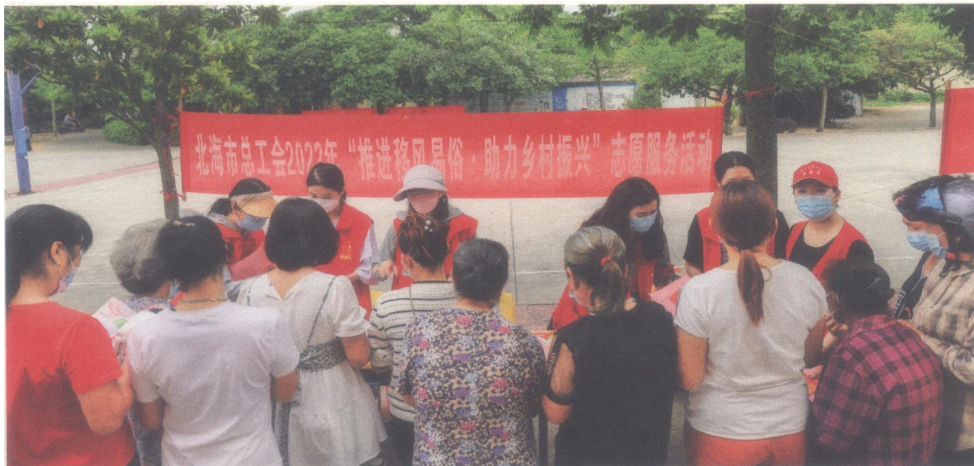
2022年4月15日，北海市总工会到帮扶村开展2022年“推进移风易俗·助力乡村振兴”志愿服务活动