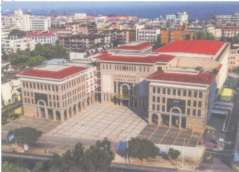
坐落在北海市中山公园对面的北海市总工会工人文化宫新大楼