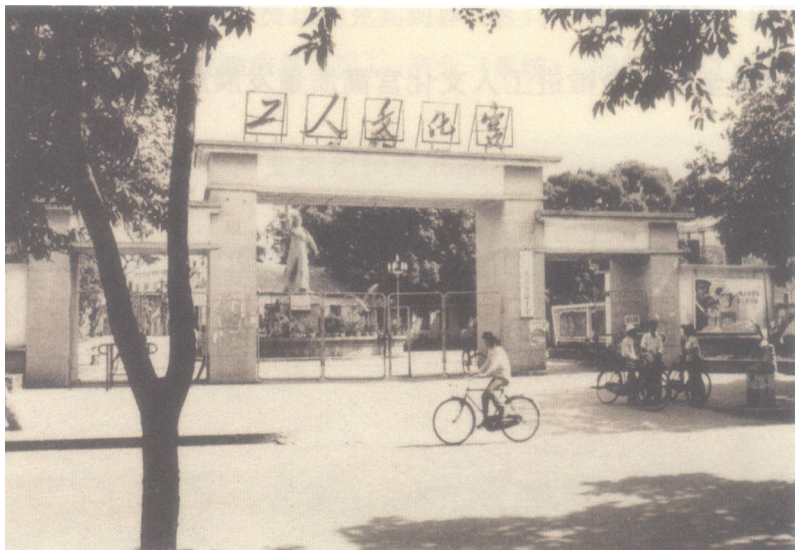
20世纪80年代的北海市总工会工人文化宫

北海市总工会工人文化宫始建于1953年，是北海市总工会主管的公益性文化事业单位，是党和工会密切联系职工群众的桥梁和纽带，是广大市民和职工文化熏陶、学习、健身和休闲的“学校和乐园”。北海市总工会工人文化宫以“工人”“公益”“公共文化”为主题，全力打造职工思想引领高地、职工教育培训园地、职工文体活动阵地、职工维权服务基地。积极探索工人文化宫活动场所“公益性、服务性、市场化、社会化”管理模式，确保在市场经济环境下实现可持续发展，为服务职工夯实物质基础。着力于打造“惠工”特色品牌，每年定期开设太极、瑜伽、书法等16项免费或低收费培训课程，广泛开展群众喜闻乐见、丰富多彩、健康向上的文体活动，为北海市精神文明建设作出应有贡献。未来，北海市总工会工人文化宫将着力争取创建全国标准工人文化宫，努力将工人文化宫建设成凝聚人心、引导职工、服务群众的坚实阵地。