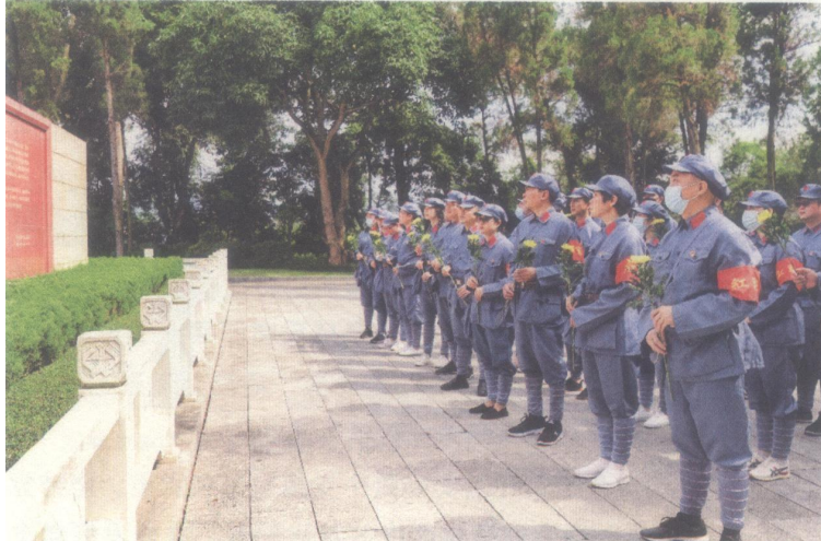
2021年6月10日，北海市总工会赴百色开展“打卡红色教育基地”活动