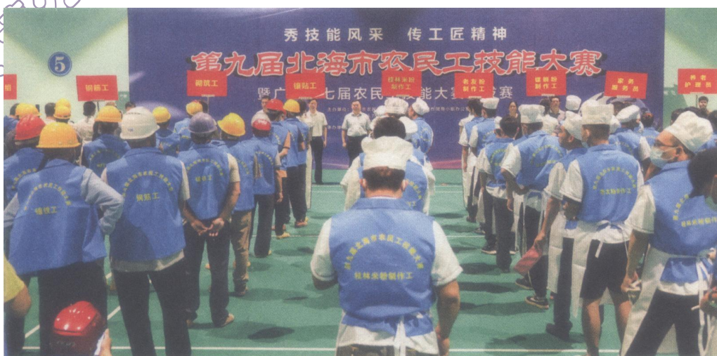
2022年6月15日，第九届北海市农民工技能大赛暨广西第七届农民工技能大赛选拔赛开幕