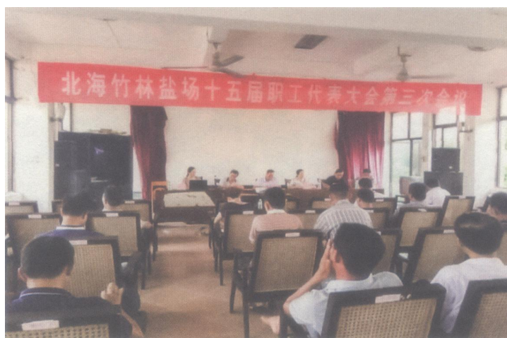
2019年4月30日，北海竹林盐场召开十五届职工代表大会第三次会议