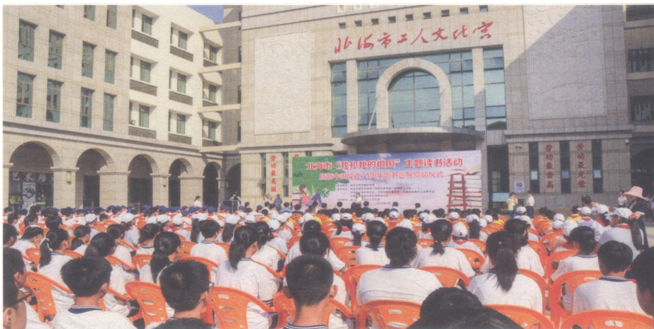
2019年9月20日，北海市“我和我的祖国”主题读书活动启动