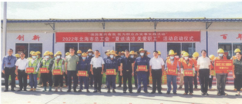
2022年7月1日，北海市总工会开展“强国复兴有我 我为群众办实事实践活动”——2022年北海市总工会“夏送清凉 关爱职工”活动