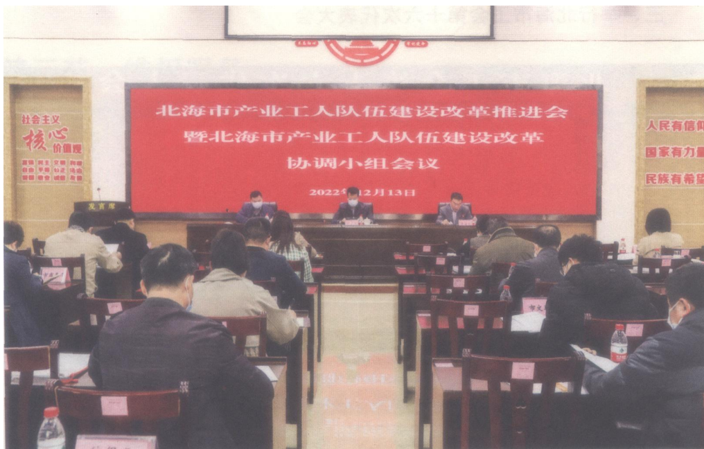
2022年12月13日，北海市产业工人队伍建设改革推进会暨北海市产业工人队伍建设改革协调小组会议在北海市总工会工人文化宫新时代文明实践中心召开