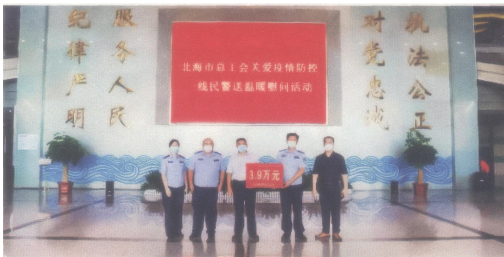
2022年8月15日，北海市总工会开展关爱疫情防控一线民警送温暖慰问活动