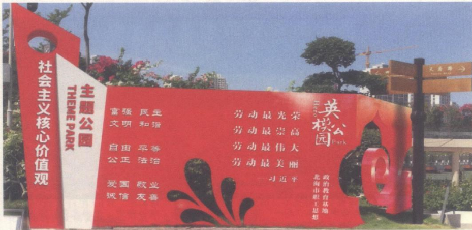
2019年1月24日，北海市花公园英模公园建成启用