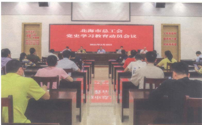
2021年3月18日，北海市总工会在北海市总工会工人文化宫新时代文明实践中心召开党史学习教育动员会议