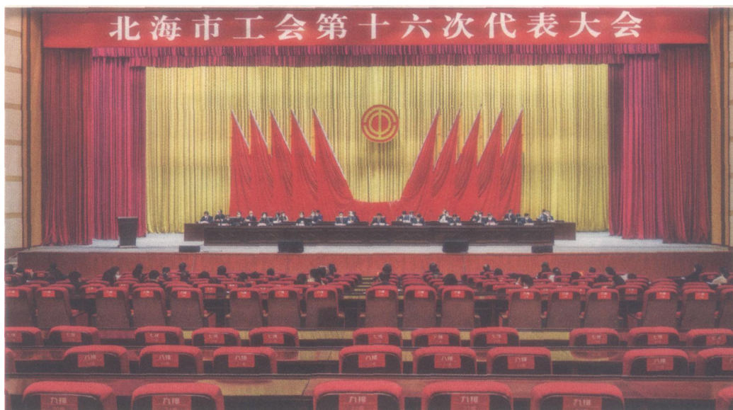
2022年12月26日至28日，北海市工会第十六次代表大会在北海市委党校举行